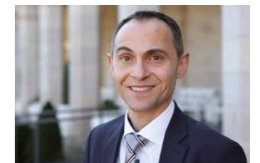
Christian Pilger Berater VR Private Banking